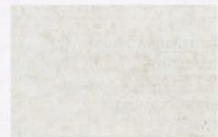
Ламинат из коллекции Casa V4, Witex . Цвет – лаймстоун, 253 грн/м 2