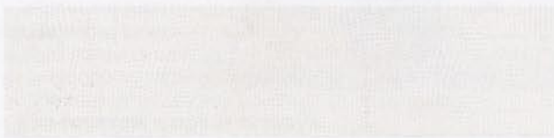
Ламинат из коллекции Piazza, Witex . Цвет – дуб белый, 253 грн/м 2

Для небольших помещений очень важно использовать приемы, позволяющие визуально расширить пространство. Отлично справляется с этой задачей, например, напольное покрытие светлых тонов.